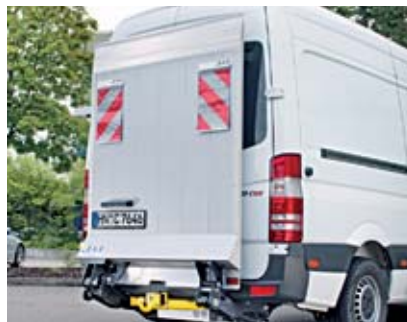
Bär VanLift Standard.