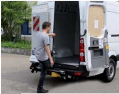
Свободный, безопасный доступ без использования гидроборта.