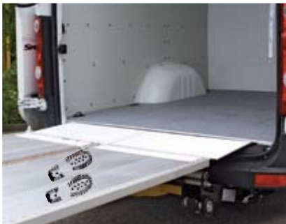
VanBridge соединяет пол фургона и платформу. Разница по высоте 12 мм в стандартном исполнении пола фургона.