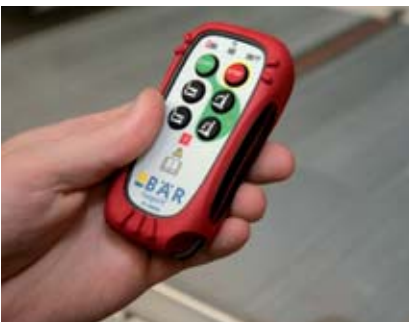
Простое управление: дистанционное управление с защитным интервалом времени.