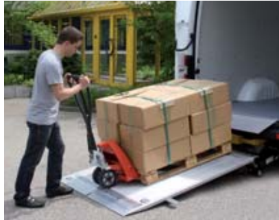
Достаточно места для европаллеты и роклы. Очень плоский угол (7,7°). Соблюдайте допустимую нагрузку.