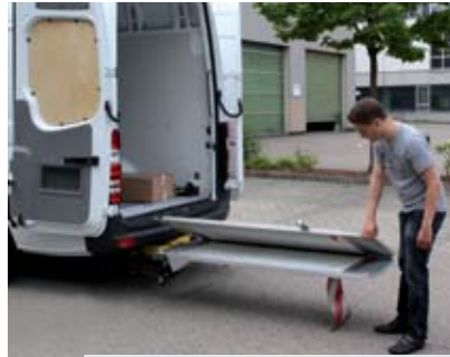
Гидравлически открывается и раскладывается от руки.